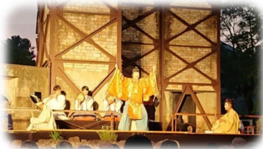
菫山反射炉で舞う伝統芸能・三番叟の饗宴より

今定例会では、初日冒頭、小野市長より行政報告及び上程議案の一括提案理由の説明がされた後、市当局より「平成30年度伊豆の国市一般会計継続費繰越計算書」、「平成30年度伊豆の国市一般会計繰越明許費繰越計算書」、「平成30年度伊豆の国市下水道事業特別会計繰越明許費繰越計算書」の報告がされました。その後、条例案件3件、補正予算案件2件が提案され原案どおり可決されました。